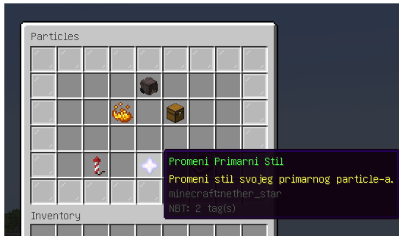
SLIKA BR. 1